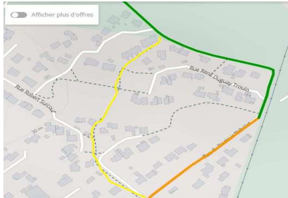
En jaune le nouveau tracé

D'autre part le tracé de Véloodyssée a été modifié (il y a déjà 2 à 3 ans) par l'implantation de cette Zac, mais le plan/itinéraire sur le site interne ne l'est pas à ce jour, comme on peut le voir sur le plan qui suit :